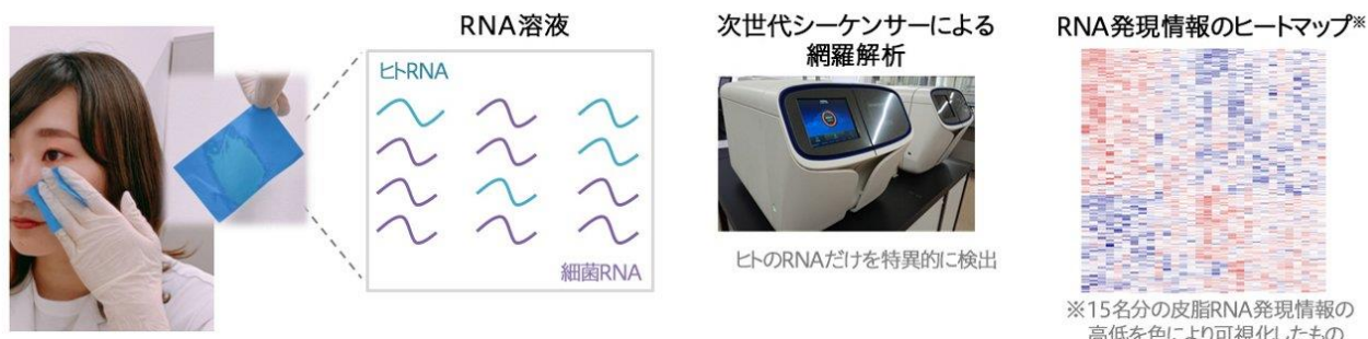
図1 RNA モニタリング～皮脂採取、RNA の抽出、精製および解析の流れ