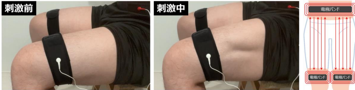
図2. e-Nudgeデバイスによる刺激前と刺激中の画像