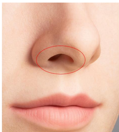
図2 陰影部分の“internal color bleeding”

人の肌には半透明性があり、光が当たると、その光の一部は肌を透過し、肌内部で散乱・吸収され、その後肌の外に出ていきます。そこで今回、肌サンプルが人の肌と同様の半透明性を持っているのかを、花王が開発したエッジロス法*3を用いて分析しました。この結果、Kazu Hiro 氏による肌サンプルは、長波長ほど半透明性が高いといった人の肌で見られる性質が認められました。さらに、人の肌特有の半透明性によって生じる、陰影部分が赤く色づいて見える“internal color bleeding” *4 と類似した現象が見られることも確認できました(図2)。