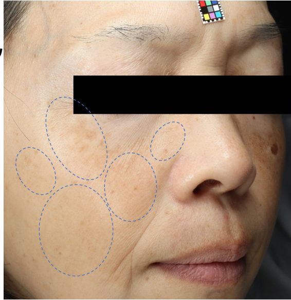
図 2. 複合ケア群（LT施術とルシノール®配合製剤の併用）の代表例