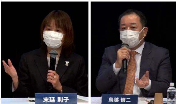
2021/11/24 日本経済新聞社主催 ※無断使用・転載禁止

『me-fullness』2022年1月13日午前10時から一般向け配信を開始(2022年1月11日) http://www.pola-rm.co.jp/pdf/release_20220111_03.pdf