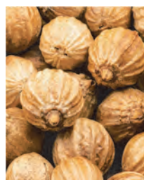
■図1 コリアンダー種子

こうした研究の積み重ねにより、SEPIBLISS™ FEELは“肌と心の両方に寄り添う”という新しい価値を備えた原料として誕生しました。ストレスによる敏感さ、炎症、心地よさの低下に包括的にアプローチする、現代のための「ストレス由来の不快感を鎮め、ほっとする肌へ導く成分」として開発されました。