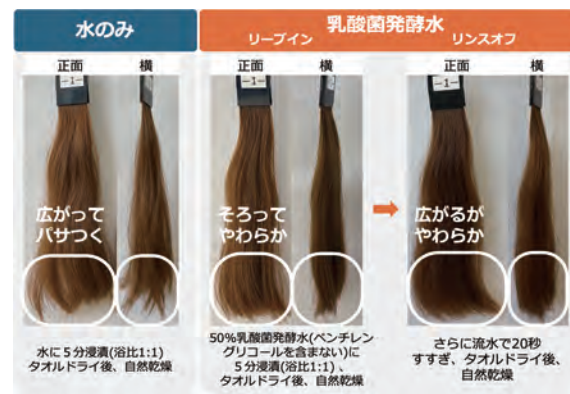
■ 図2 毛髪への効果